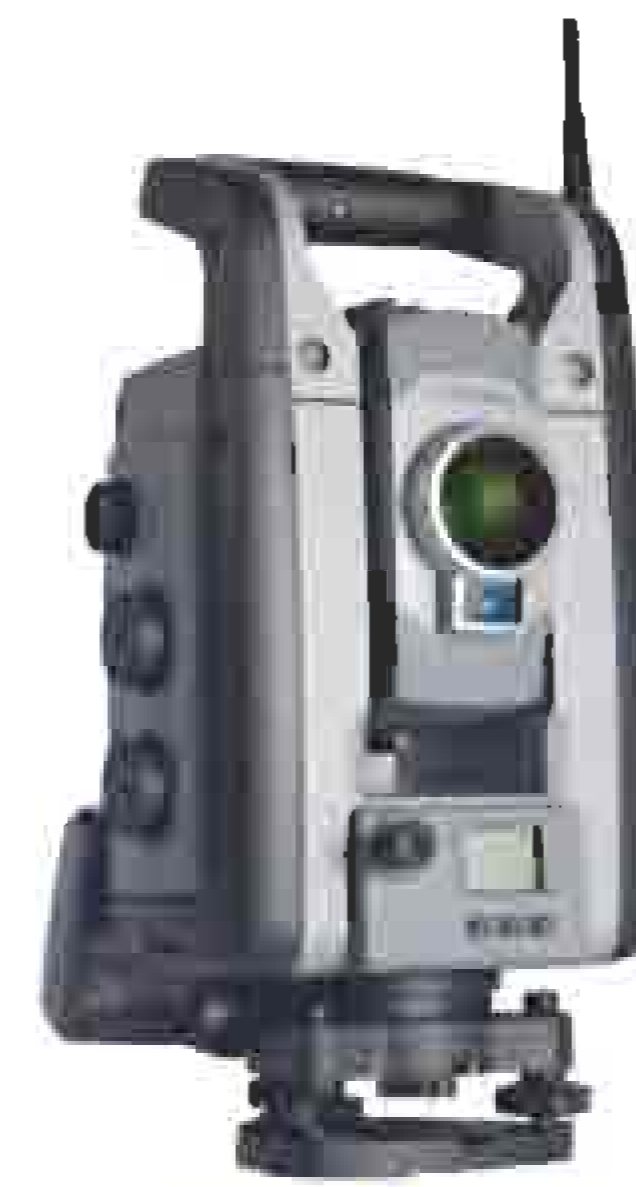
Trimble M3 Servo taxometri