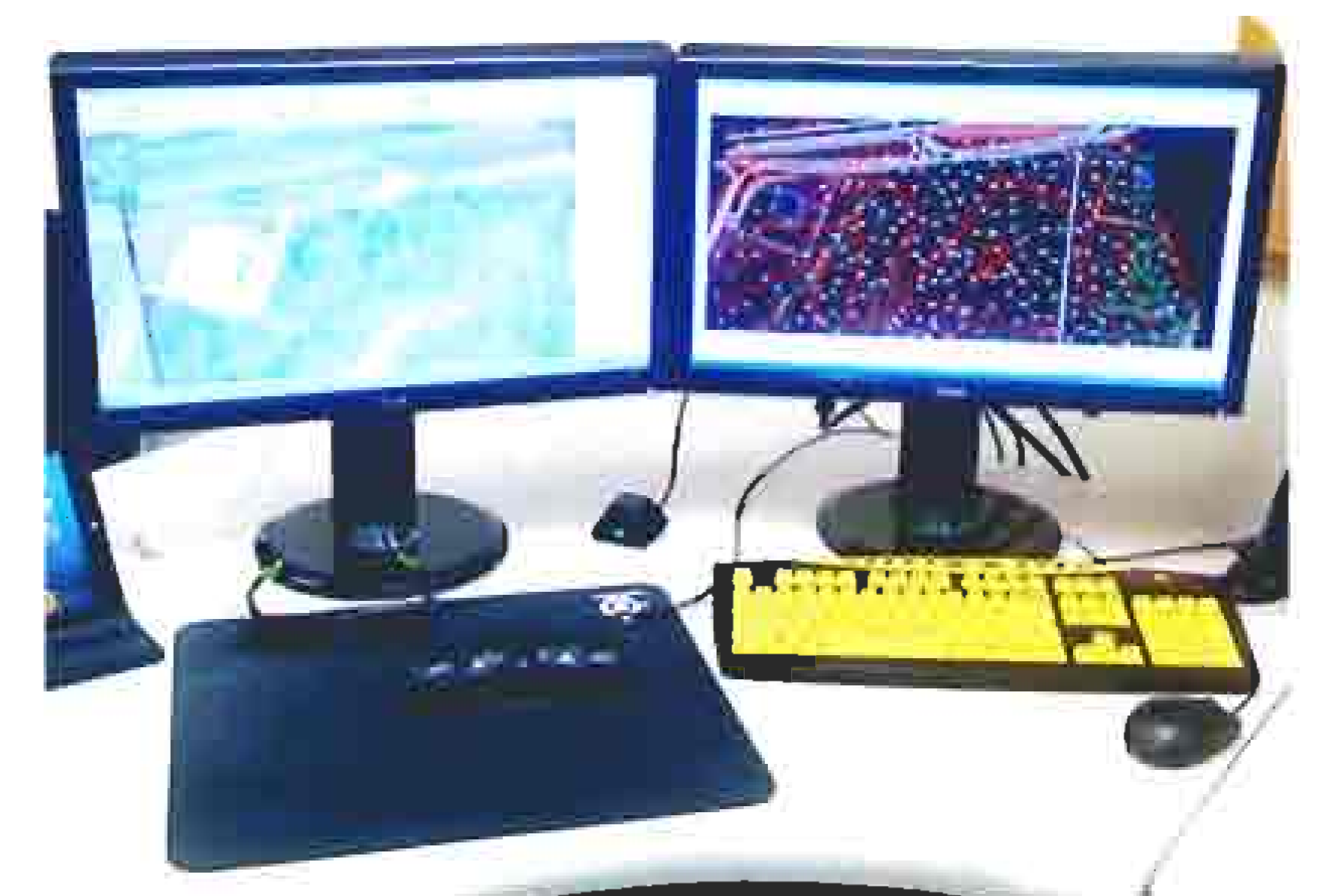
Fotogrammetrik ish stansiyasi