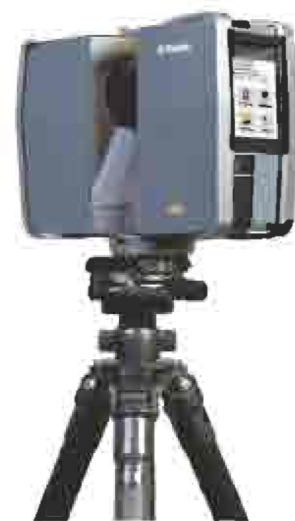
Trimble® TX5 3D laserli skaneri