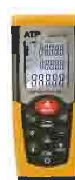
Laserli masofa o'lchagich