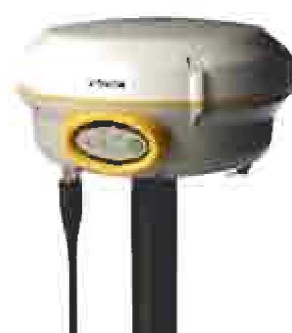
GNSS rover-Trimble R